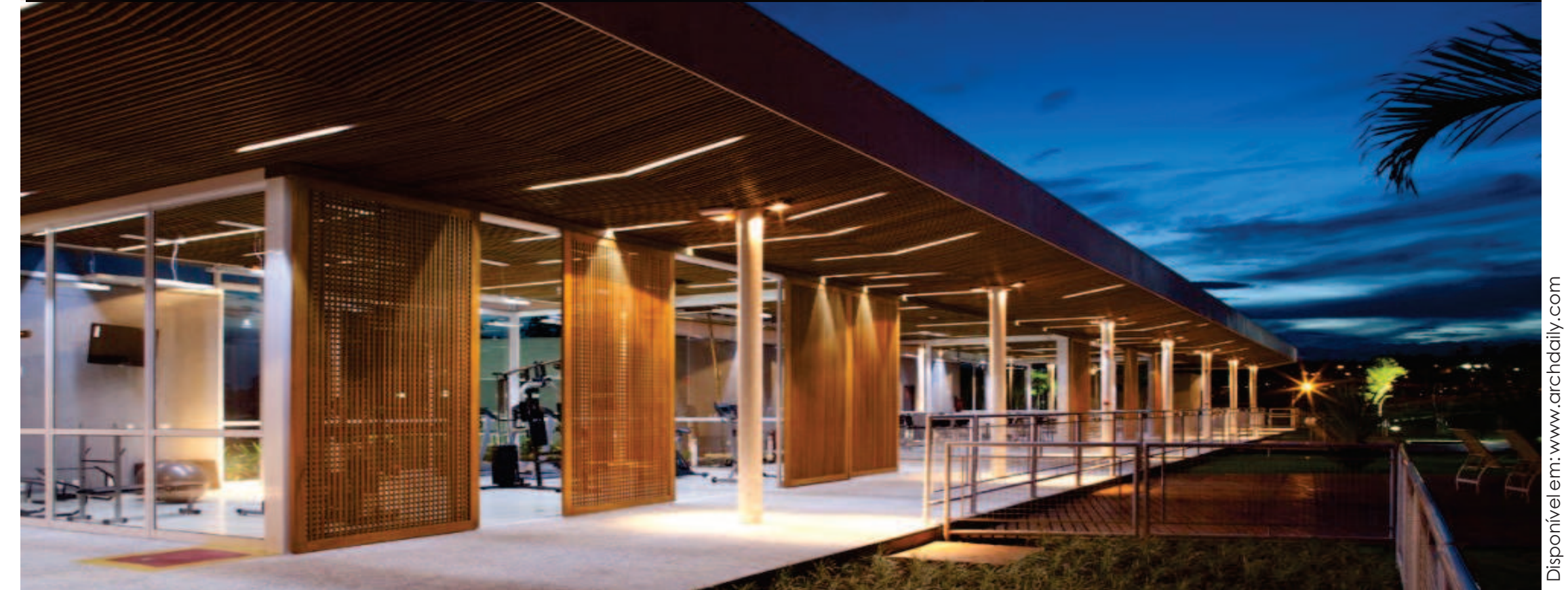
Disponível em: www.archdaily.com